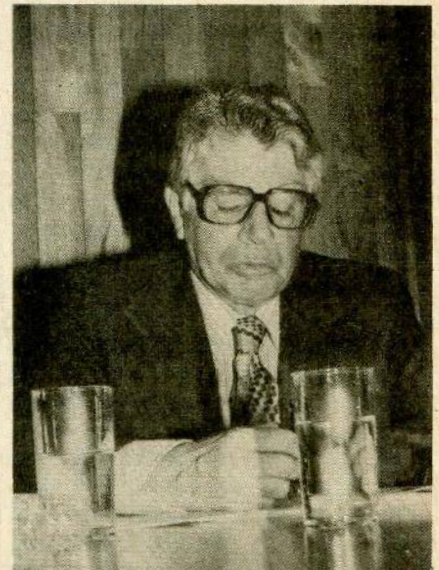
Doctor Leopoldo Zea, director del Centro de Estudios Latinoamericanos de la Facultad de Filosofía y Letras de la UNAM, y coordinador general del mencionado Simposium.

“Cerramos pues, estas jornadas de intenso trabajo, con la convicción de que los esfuerzos presentes y los proyectados al futuro, nos acercan más a esa meta como clave de identidad, de dignidad y de justicia a nuestro propio ser latinoamericano”.