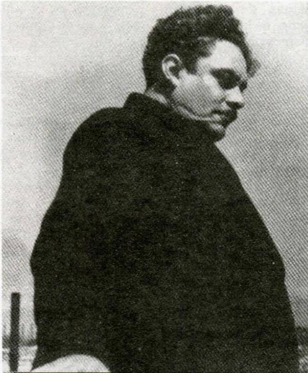
EL MAESTRO SILVESTRE REVUELTAS

Durante el Primer Coloquio Internacional: Silvestre Revueltas, hacia el centenario se inauguró una exposición fotográfica en la Biblioteca Cuicamatini de la Escuela Nacional de Música de la UNAM, además del concierto de apertura en el que se tocaron algunas de sus obras. Los temas más relevantes que se trataron durante las mesas de trabajo fueron: «Nacionalismo y Universalismo en la obra de Revueltas, Roldán y Caturra», de Zoila Gómez, «Silvestre Revueltas por escrito (la prensa, las letras y el músico)» por Ricardo Pérez Montfort, «Silvestre: totalidad esencial» de Julio Estrada, «Conformismo ante rebelión: el espíritu de la obra de Silvestre Revueltas» trabajo elaborado por Peter Garland, «Silvestre Revueltas en la encrucijada» de Eugenia Revueltas, «Creación artística y soli-