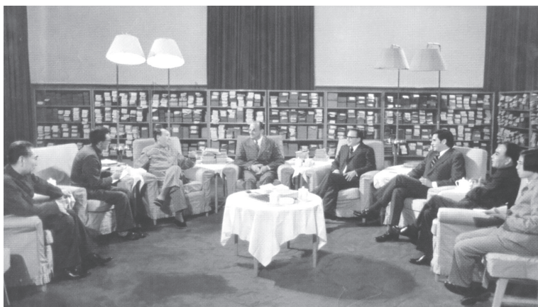
Entrevista del presidente chino Mao Tse Tung con Luis Echeverría

Por supuesto, los eventos más importantes de la visita de Echeverría a China fueron conversaciones oficiales con los líderes de nuestro país. En particular se reunió con el presidente Mao y sostuvo conversaciones con el primer ministro Zhou. Durante los pocos días de la visita, el primer ministro Zhou sostuvo cinco conversaciones con el presidente mexicano,