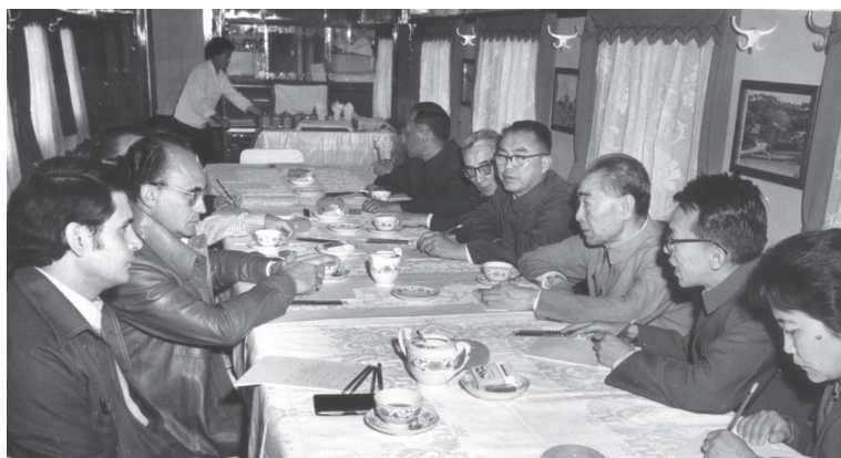
Conversación con el primer ministro Zhou Enlai en el tren

La última cuestión versaba sobre el desarrollo económico. Las dos partes presentaron sus respectivas experiencias. El primer ministro Zhou dijo que si no se resolvía el problema alimentario de un país, la industria no podría desarrollarse y que si el problema agrícola se resolvía, habría una base para desarrollar la economía y desarrollar aún más la industria pesada. Después del final de cada reunión, Echeverría y su comitiva no podían dejar de expresar su profunda admiración por los amplios conocimientos de Zhou Enlai, la profundidad de sus reflexiones filosóficas y el respeto a los pequeños países.