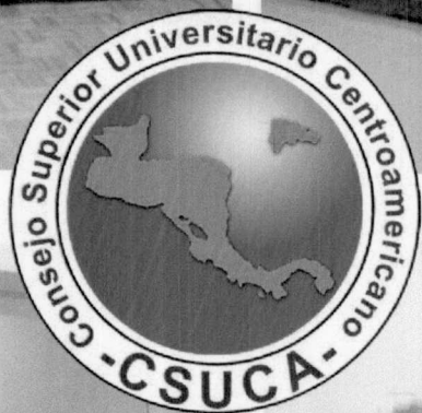
Fotos del VIII Congreso Universitario Centroamericano Panamá, 26 y 27 de mayo 2016.